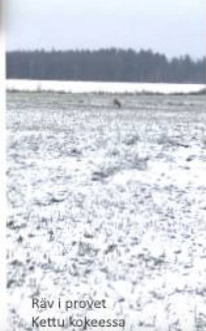
Räv i provet Kettu kokeessa